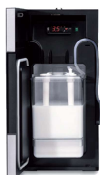
1 milk solution