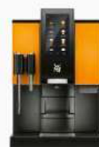
Gloss Burnt Orange