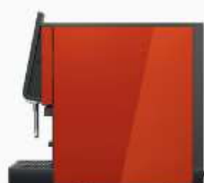
Side Gloss Hotrod Red

3 - termin dostawy trzeba uzgodnić przy zamówieniu.