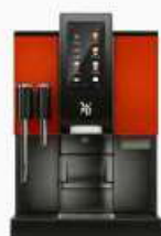
Gloss Hotrod Red