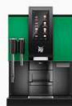
Gloss Kelly Green