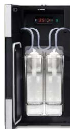
2 milk solution

Lodówka na mleko dla wszystkich modeli ekspresów (poza ekspresami z systemem BASIC MILK, WMF 950 S i 1100S)